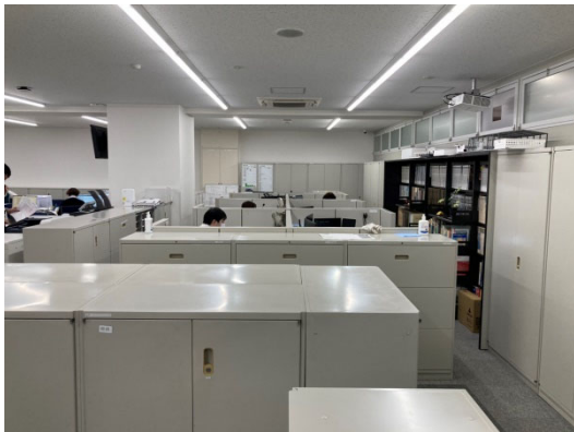
リニューアル後（イメージ）